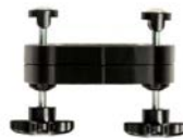
Kit de elevación de pedales