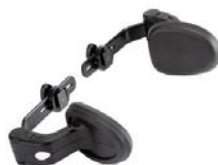
Soportes laterales de tronco grandes