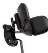
Reposacabezas con laterales