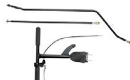
Barra de dirección trasera con freno de mano trasero