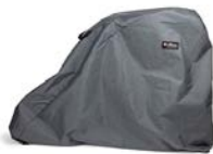
Funda para exterior