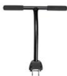
Barra de empuje