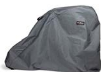
Funda para exterior