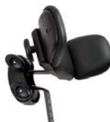
Reposacabezas con laterales