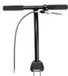
Barra de empuje con freno de mano trasero