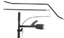
Barra de dirección trasera con freno de mano trasero