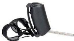
Abductor con correas de aducción