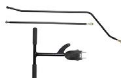
Barra de dirección trasera