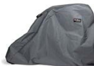
Funda para exterior