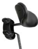
Reposacabezas contorneado - Ajustable