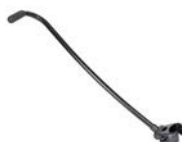
Barra de guía delantera