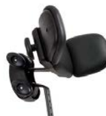
Reposacabezas con laterales