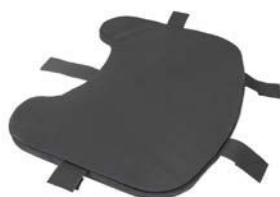
Acolchado de la bandeja