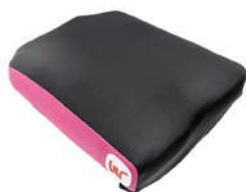
Funda exterior de cojín de repuesto