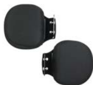
Controles de hombros