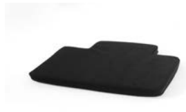
Cojín para base ***

** El reposapiés y el estabilizador de suelo no se pueden usar conjuntamente.