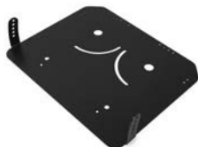
Función de basculación 10°