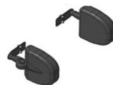
Soportes laterales abatibles****