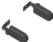
Soportes de tronco abatibles****