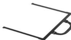
Arco estabilizador *

* El adaptador Isofix y el arco estabilizador no se pueden usar conjuntamente