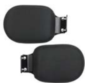
Soportes de tronco fijos****