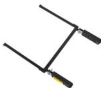
Adaptador Isofix *

OBLIGATORIO: ESCOJA ELEMENTO NECESARIO PARA LA ESTABILIDAD: Utilizar siempre el asiento de posicionamiento con adaptador Isofix o arco estabilizador