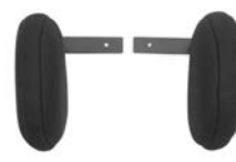
Guía de piernas