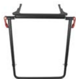
Estabilizador de suelo **