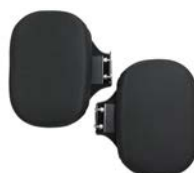
Soportes laterales fijos****