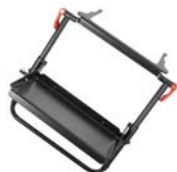
Reposapiés, plegable **