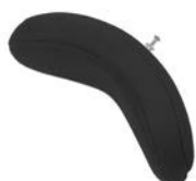
Reposacabezas ajustable en altura