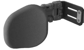
Controles de tronco (como mínimo 1 abatible)