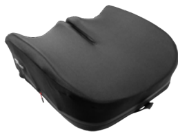
Funda exterior extra