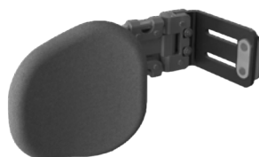
Controles de tronco (como mínimo 1 abatible)