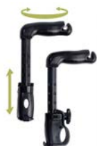
Par de empuñaduras extra