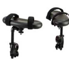
Soportes para antebrazos