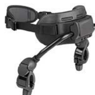
Soporte de pecho