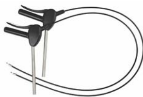
Freno de mano para base exterior