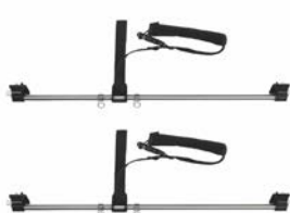
Soporte de tobillos para base estándar