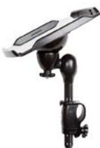
Mesa para comunicador