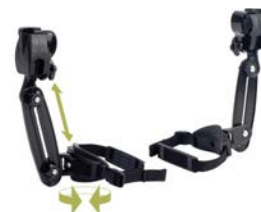
Soporte para muslo