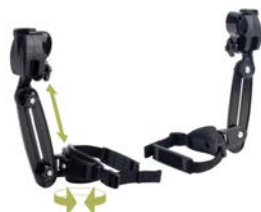
Soporte para muslo