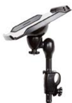
Mesa para comunicador