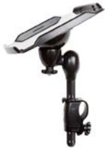
Mesa para comunicador