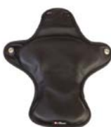
Acolchado posicionador de cadera