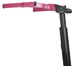
Chasis superior estándar