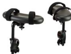
Soportes para antebrazos