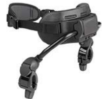
Soporte de pecho