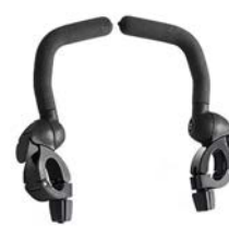
Barras de apoyo