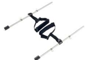
Soporte de tobillos para base estándar