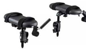
Soportes para antebrazos con empuñaduras