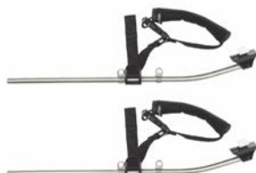
Soporte de tobillos para base exterior