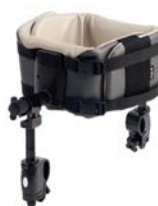
Soporte de tronco