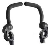
Barras de apoyo