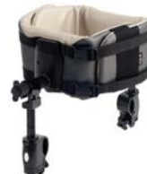
Soporte de tronco