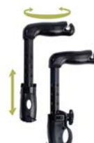
Par de empuñaduras extra