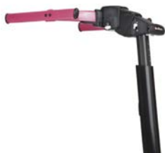
Chasis superior dinámico

CHASIS Y BASE - Obligatorio escoger un chasis y una base