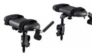
Soportes para antebrazos con empuñaduras