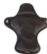
Acolchado posicionador de cadera