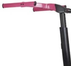
Chasis superior estándar