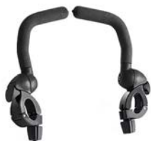
Barras de apoyo