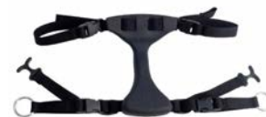
Posicionador de cadera