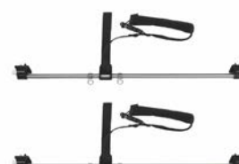
Soporte de tobillos para base estándar