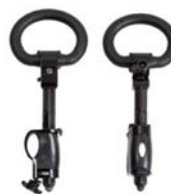
Par de apoyo manos cerrado