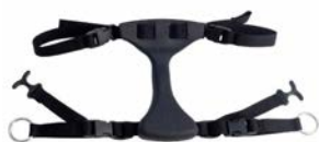
Posicionador de cadera