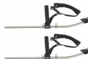
Soporte de tobillos para base exterior