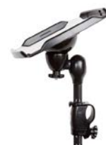
Mesa para comunicador