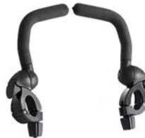
Barras de apoyo