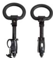
Par de apoyo manos cerrado