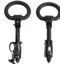
Par de empuñaduras