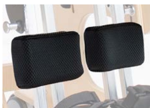
Acolchado soporte de piernas