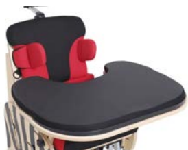
Mesa / Funda mesa