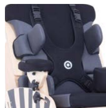
Talla 3 (gris)