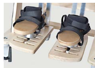
Reposapiés ajustable 3D