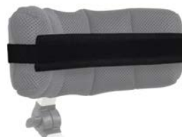
Cinturón de sujeción de cabeza