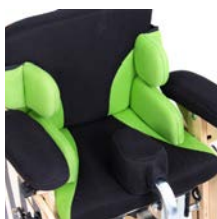
Talla 1 (verde)