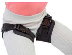
Cinturón de abducción de piernas