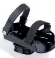
Pedales tipo sandalia