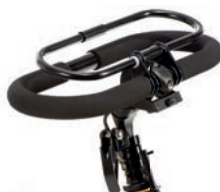
Manillar cerrado con sistema de freno