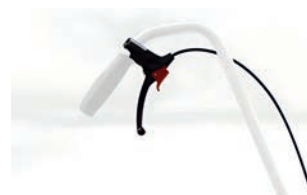
Freno acompañante para barra de empuje