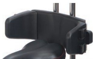
Control pélvico ajustable