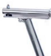
Soporte de sillín en forma de T