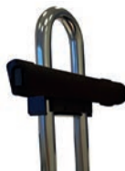
Barra universal para montar fijaciones