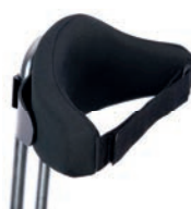
Respaldo dinámico con cinturón