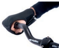
Fijación de mano