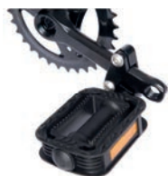
Reductor bielas pedales ajustable