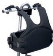
Chaleco de fijación