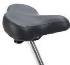
Sillín tipo ciclomotor