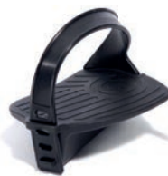
Pedales con fijación