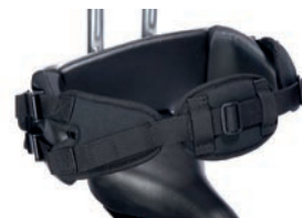
Cinturón de 4 puntos