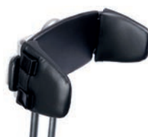
Respaldo ajustable en anchura