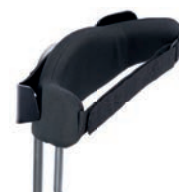
Control pélvico dinámico