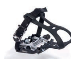
Pedales tipo ciclismo