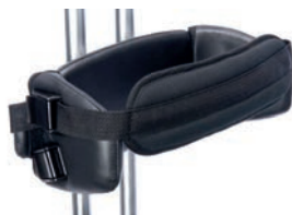
Cinturón de pecho