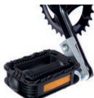
Reductor bielas pedales