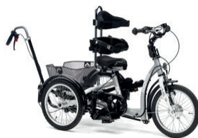
Barra de empuje direccional