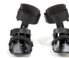
Pedales con soporte dinámico de tobillo