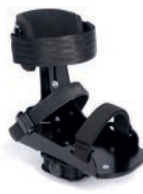
Pedales con soporte de tobillo