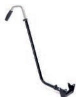
Barra de empuje