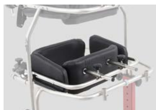
Soporte pélvico de Paramobil - Para talla 3