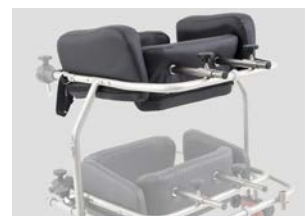
Soporte torácico de Paramobil - Para talla 3