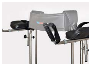
Soportes de antebrazos