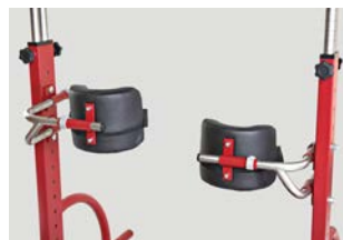
Soportes de rodillas ajustables