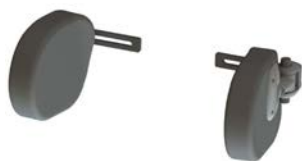
Soportes de hombro