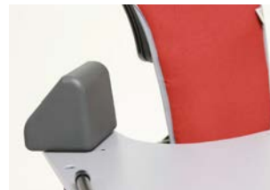
Bloques para codos