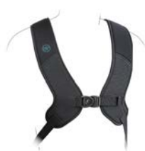
Arnés dinámico en H PivoFit