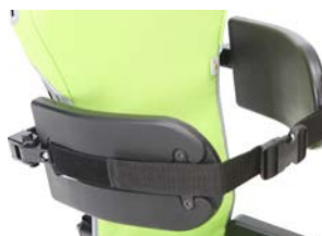
Soportes torácicos con cincha