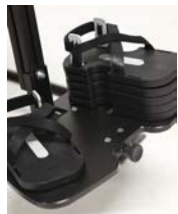
Bloques para una sandalia