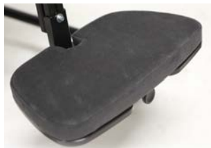
Plataforma reposapiés acolchada