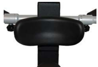
Apoyo de tronco