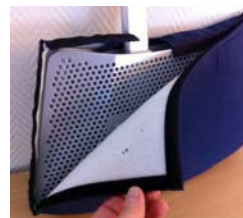
Funda para divisoria de piernas