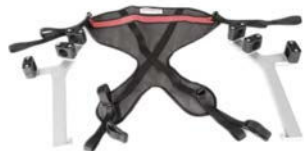
Sustentador pélvico con soportes