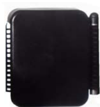
Bloque extra para soporte de tronco