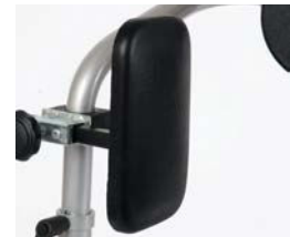
Soportes de cadera