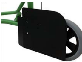
Guías para piernas