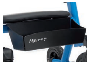
Cesta para T.0 o T.1