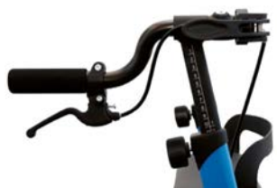
Freno de mano