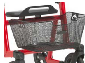
Cesta para T.1 o T.2