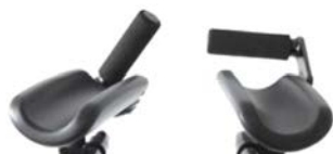
Soportes de antebrazos con empuñaduras ajustables