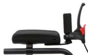
Freno de estacionamiento