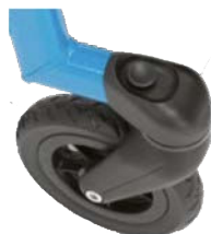
Bloqueo de dirección