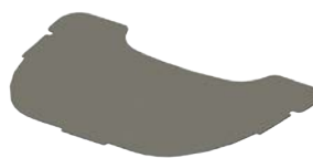
Reductor escotadura mesa