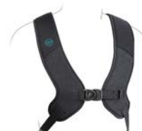
Arnés dinámico en H PivoFit