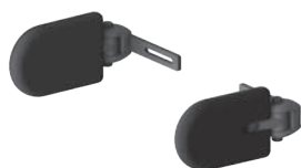
Soportes torácicos cortos