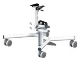
Base X - Blanca alta