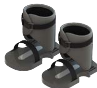
Sandalia con tobillera