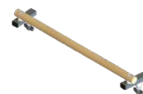
Barra de agarre