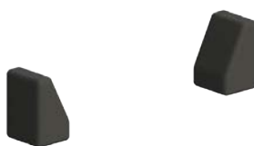
Bloque para codos