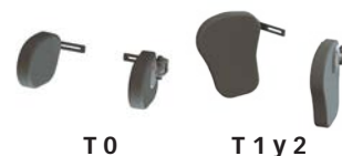
T 0 T 1 y 2 Protectores para hombros