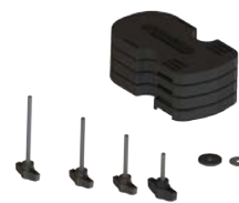
Bloques para una sandalia