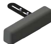
Extensión de asiento