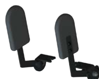
Soportes laterales piernas