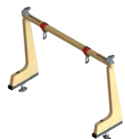
Arco para juegos