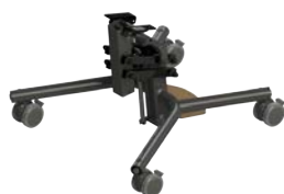
Base X - Negra baja