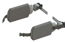
Soportes torácicos Flexi con cincha