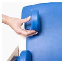
Soportes de pelvis