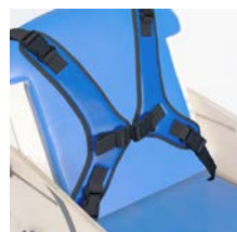
Arnés en forma de H