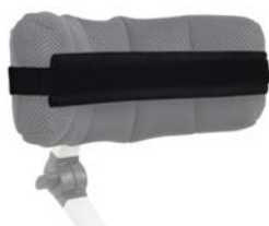
Cincha fijación de cabeza