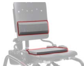
Kit soporte lumbar y asiento