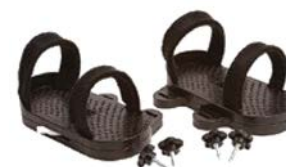
Par de sandalias