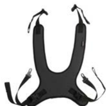
Peto de fijación estándar