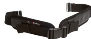
Cinturón de pierna