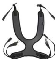
Peto de fijación estrecho