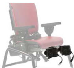
Soporte de piernas