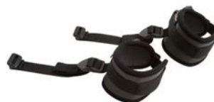
Par de bandas de tobillos