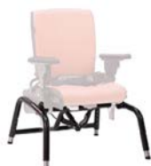
Base con basculación