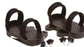
Par de sandalias