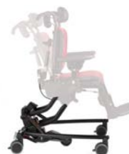
Base Hi-Lo con basculación y ruedas