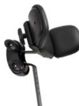
Reposacabezas con alas ajustables