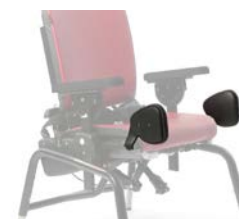
Par de adductores