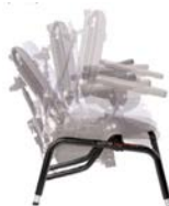
Base con basculación y asiento dinámico