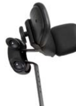
Reposacabezas con alas ajustables