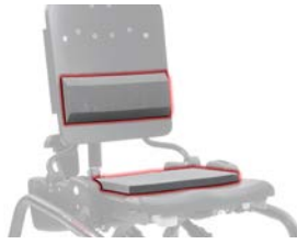
Kit soporte lumbar y asiento