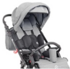
Gris (bajo pedido)