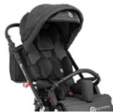
Negra (bajo pedido)