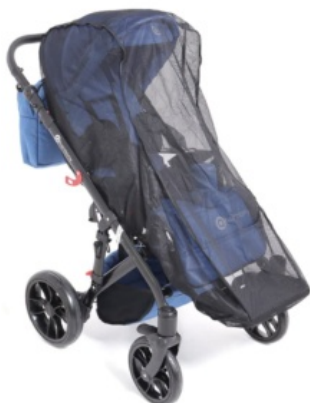
Red anti-mosquitos Harmony