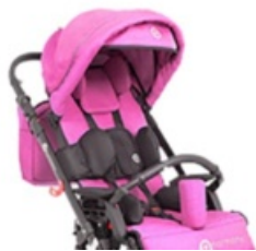
Rosa (bajo pedido)