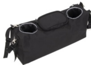
Bolsa organizadora Harmony