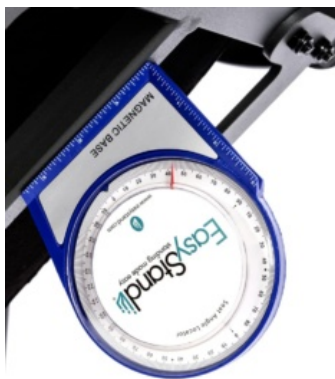
Identificador d'angle EasyStand