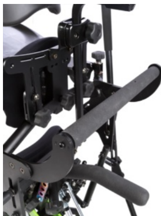
Nanses d'empenta EasyStand