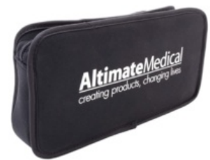
Bossa d'eines EasyStand