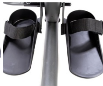
Cingles per a suports de peu Evolv i Glider