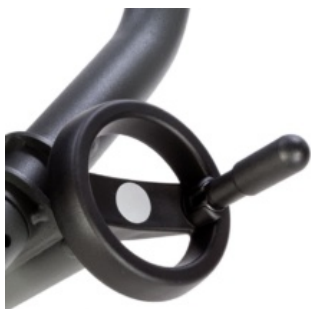
Roda d'ajust d'angle de respatller Evolv i Glider