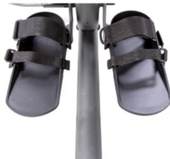
Cingles de seguretat per a suports de peu Evolv i Glider