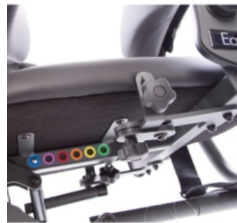
Ajust fàcil de profunditat de seient Easy Stand