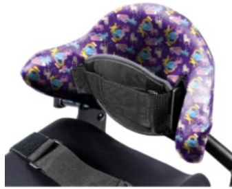
Funda higiénica para respaldo Bantam