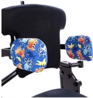
Funda higiénica para soportes laterales Bantam