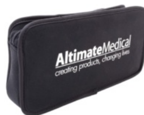
Bolsa de herramientas EasyStand