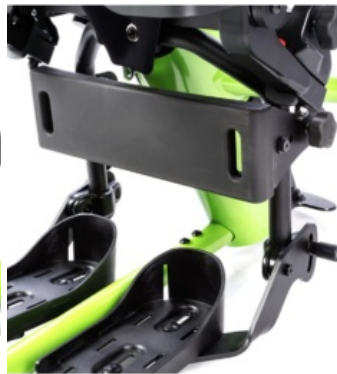
Apoyo de pantorrilla Bantam