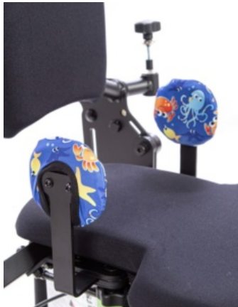
Funda higiénica para soportes de cadera Bantam