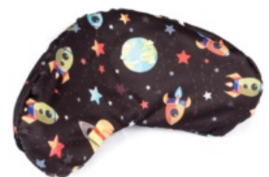
Funda higiénica para reposacabezas Bantam