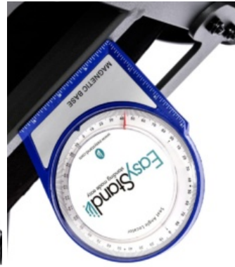
Identificador de ángulo EasyStand