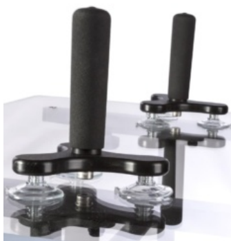
Empuñaduras Bantam y Evolv