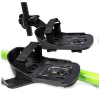
Cinchas para soporte de pies Bantam