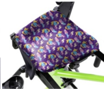
Funda higiénica para asiento Bantam