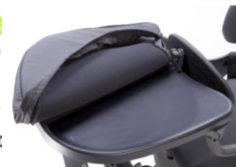
Funda higiénica acolchada para bandeja Bantam y Evolv