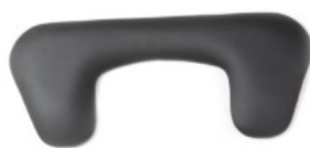
Almohadillado para codo Bantam