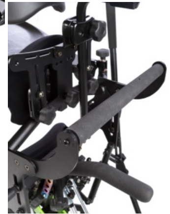
Asas de empuje EasyStand