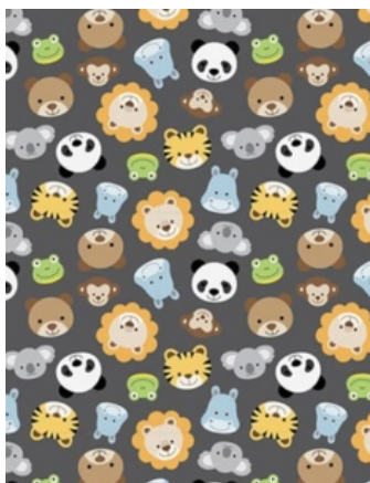
Estampados para fundas higiénicas Bantam