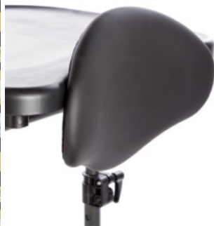
Soporte de pecho contorneado grande Bantam