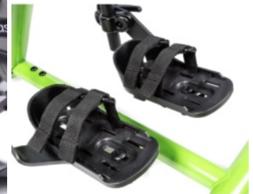
Cinchas de seguridad para soporte de pies Bantam