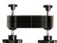
Kit d'elevació de pedals tricicle Rifton