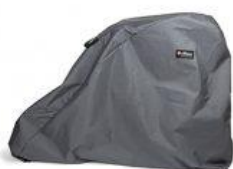
Funda per a exterior tricicle Rifton