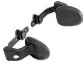
Suports laterals de tronc tricicle Rifton