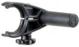
Barra per a suport de dispositius electrònics tricicle Rifton