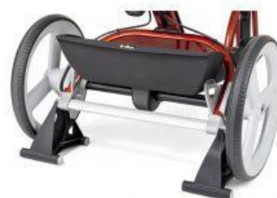
Suport estacionari tricicle Rifton