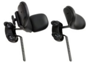
Reposacaps tricicle Rifton