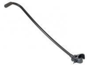
Barra de guia davantera tricicle Rifton