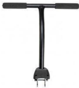
Barres d'empenta o direcció tricicle Rifton