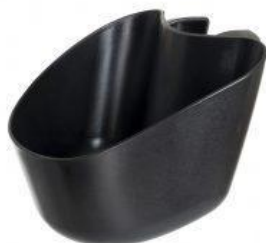
Cistella davantera tricicle Rifton