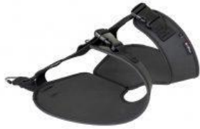
Arnès pèlvic tricicle Rifton