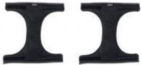
Ancoratges de mà tricicle Rifton