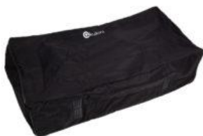
Bolsa transporte Kukini