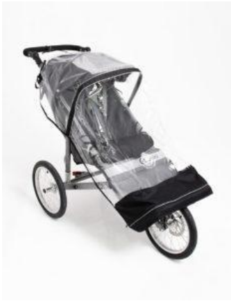
Protector de lluvia Kukini