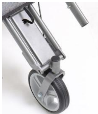
Rueda delantera giratoria Kukini