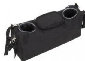
Bolso multibolsillos Kukini