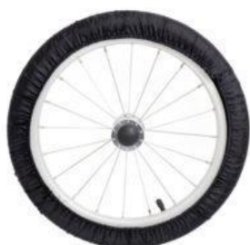
Bolsa para ruedas Kukini