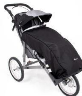
Saco de invierno Kukini