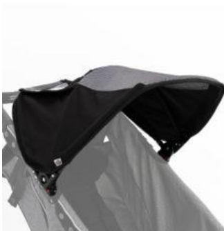
Capota plegable Kukini