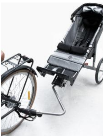
Kit de fijación y barra para bicicleta Kukini