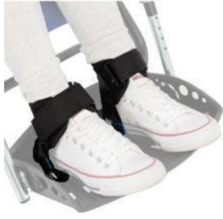
Fijaciones de tobillo Kukini