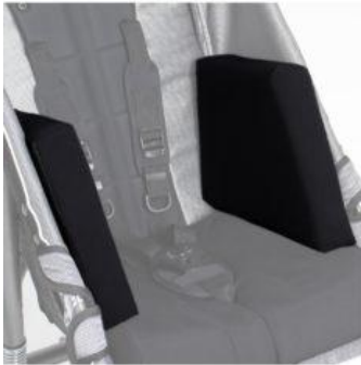
Almohadillas reductoras del ancho del asiento Kukini