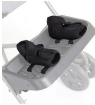
Fijaciones de pie y tobillo Kukini