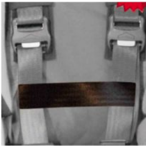
Cinturó conexió cinxes pit Hernik