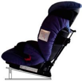
Base ajustable en inclinació Ipai-Nxt