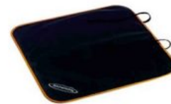
Protector seient de cotxe Hernik