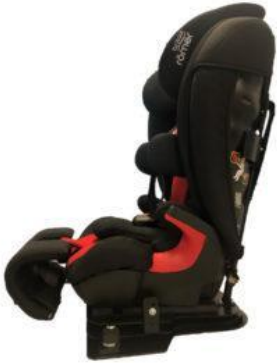
Adaptador de profunditat de seient Ipai-Nxt