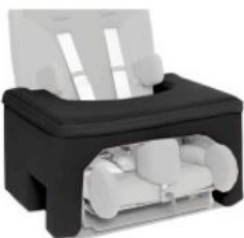
Taula de seguretat Ipai-Nxt