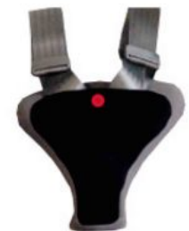
Protector de seguretat Hernik