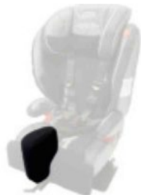
Tac abductor extraïble Ipai-Nxt