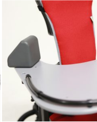
Blocs per colzes (PARELL) Junior / multiseat