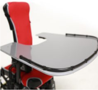
Taula Junior+ / Multiseat