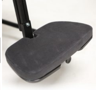
Plataforma reposapeus encoixinada Multiseat