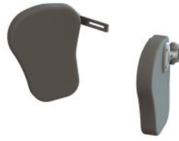
Suports d'espatlla Jenx