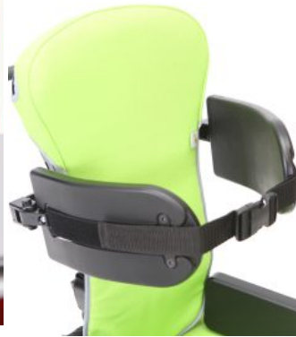
Suports toràcics Multiseat