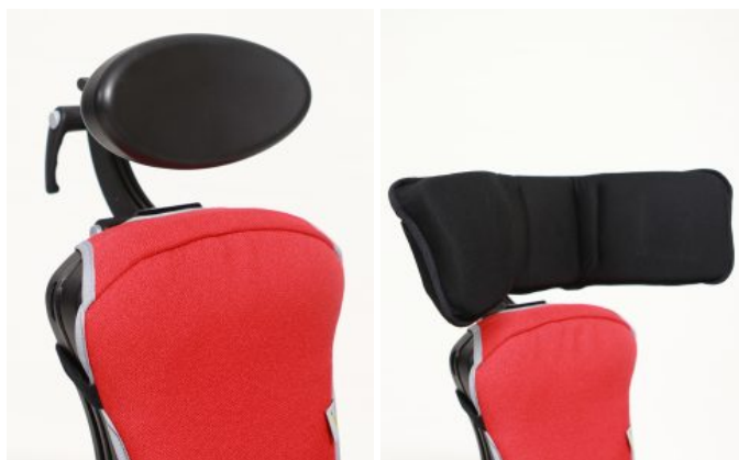
Reposacaps oval Junior / Multiseat