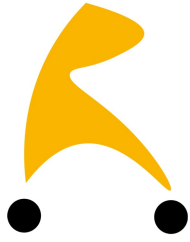
Reductor de profundidad de asiento Bee