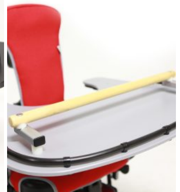
Barra de agarre Jenx