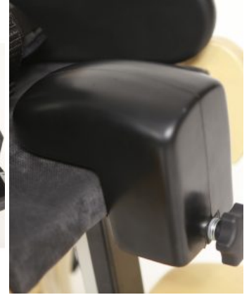
Taco abductor Bee