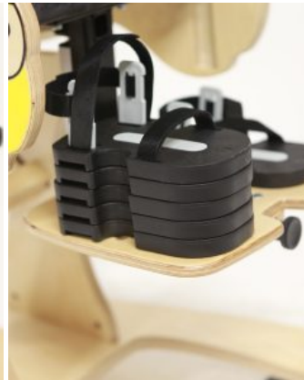
Bloques para sandalias Bee