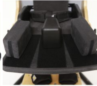
Prolongador de asiento Bee