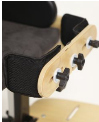
Soportes de rodilla Bee