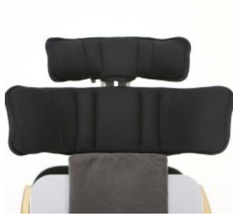
Soportes de hombro Bee