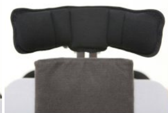
Reposacabezas multiajustable Bee