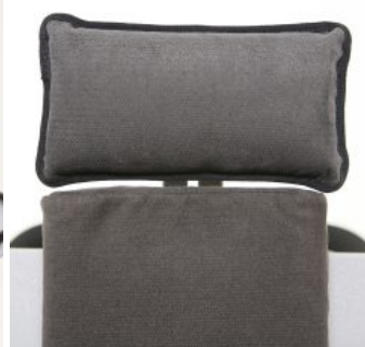
Soporte de cabeza plano Bee