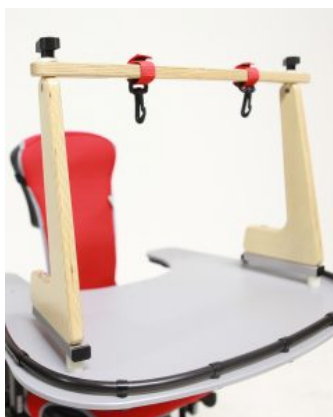
Arco para juegos Jenx