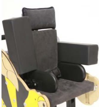
Bloques de espuma (PAR) Bee