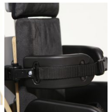
Soportes torácicos Jenx