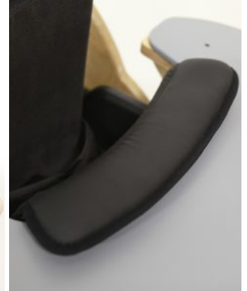
Relleno mesa Bee