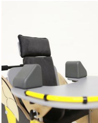
Bloques para codos (PAR) Jenx