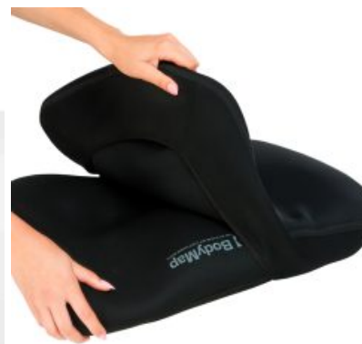
Funda Vismemo Bodymap