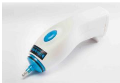
Bomba eléctrica Bodymap