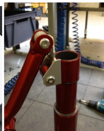
Ajustes de reducción de altura Meywalk 4