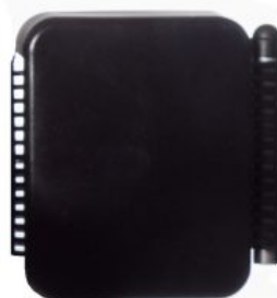
Bloque extra para Soporte de Tronco Meywalk 4