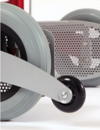
Antivuelco Meywalk 4