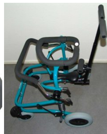
Barra de empuje Meywalk 4