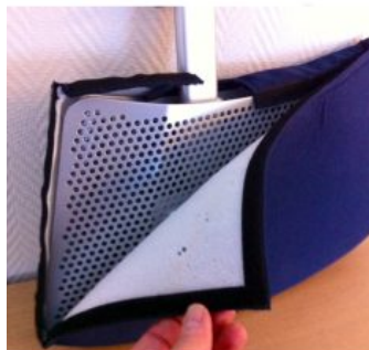
Funda para Divisoria de piernas Meywalk 4