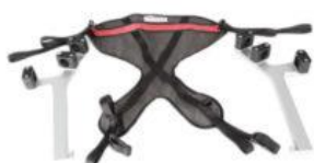
Sustentador pélvico Meywalk 4