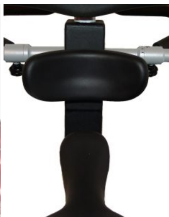
Apoyo de tronco Meywalk 4