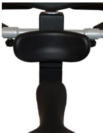
Apoyo de tronco Meywalk 4