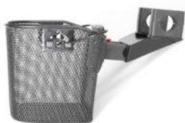
Cesta Meywalk 4