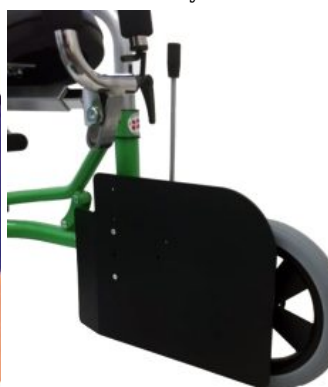
Guías de piernas (par) Meywalk 4