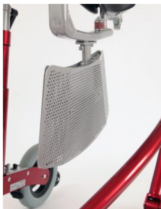
Divisoria de piernas Meywalk 4