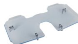
Bandeja Meywalk 4