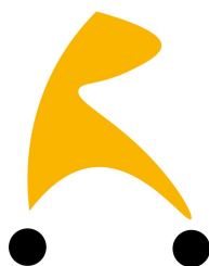
Kit de ajuste de la Almohadilla extra de soporte Meywalk 4