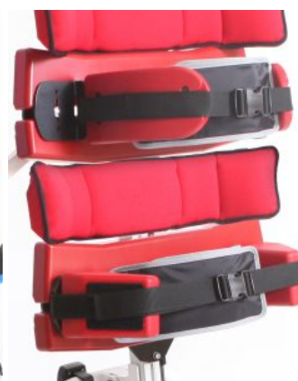
soportes postural multigrip Multistander