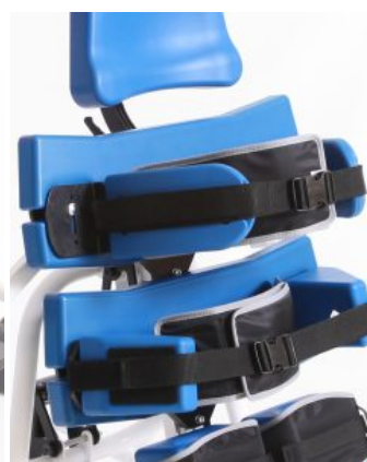
Soportes de cadera o tronco con cincha Multistander