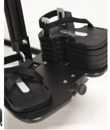
Bloques para una sandalia Multistander