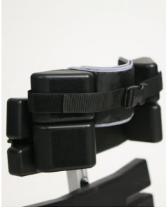
soportes torácicos dobles Multistander