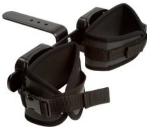
Soporte de piernas Activity Chair