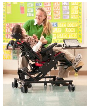
Base con basculación Activity Chair *Required