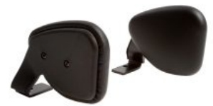
Par de adductores Activity Chair