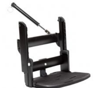
Reposapiés Activity Chair