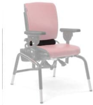
Respaldo acolchado Activity Chair