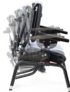
Base con basculación y asiento dinámico Activity chair *Required