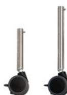
Conjunto patas largas con ruedas Activity Chair *Required