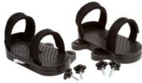
Par de sandalias Activity Chair