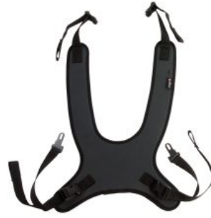
Peto de fijación Activity Chair