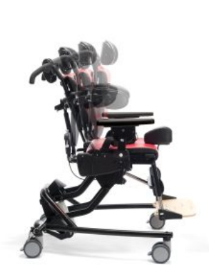
Respaldo ajustable Activity Chair *Required