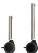
Conjunto patas cortas con ruedas Activity Chair *Required