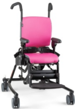
Base Hi-Lo con basculación y ruedas Activity Chair