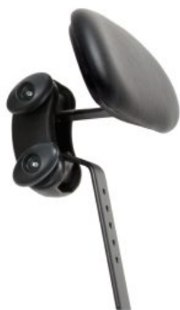
Reposacabezas plano Activity Chair