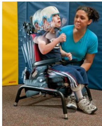
Respaldo dinámico Activity Chair *Required