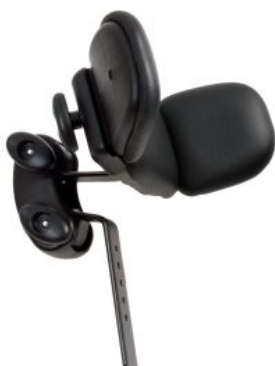
Reposacabezas con alas ajustable Activity Chair