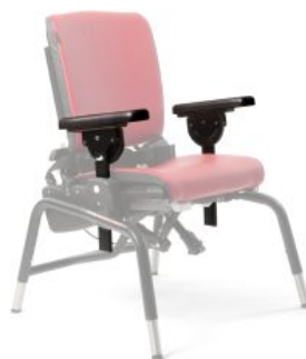
Reposabrazos Activity Chair *Required