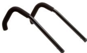
Empuñadura Activity Chair