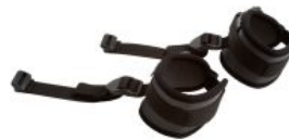
Bandas de tobillo Activity Chair