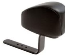
Taco abductor Activity Chair