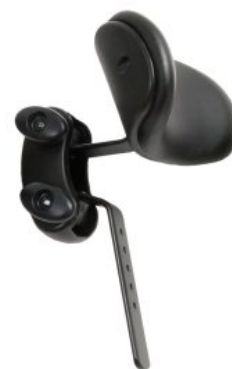
Reposacabezas curvo Activity Chair