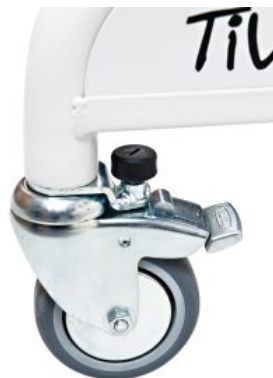
Ruedas con bloqueo de dirección (2 unidades) Activall