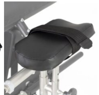
Soporte de antebrazo (2 unidades) Activall