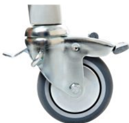
Ruedas con bloqueo antiretroceso (2 unidades) Activall