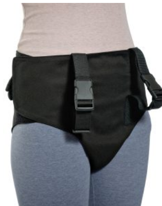
Arnés pélvico Activall