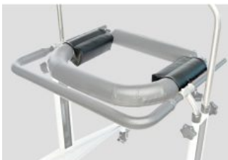
Pad de estrechamiento de soporte de cadera Activall