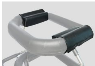
Pad de estrechamiento de soporte de pecho Activall