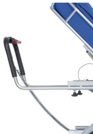
Extensió per a empenyadura Tina