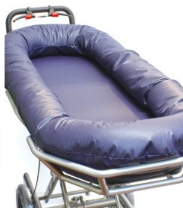
Suport de matalàs contourable amb guia lateral per matalàs Tina