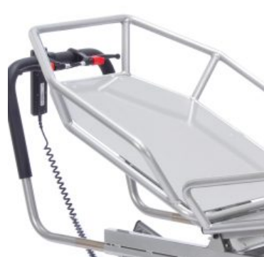
Bases per a Tina *Required