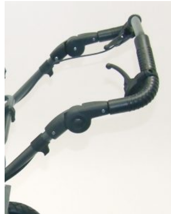
Freno de tambor Bingo / Bingo OT