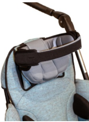
Headaloft en Bingo