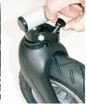
Bloqueo de dirección Bingo/Bingo OT