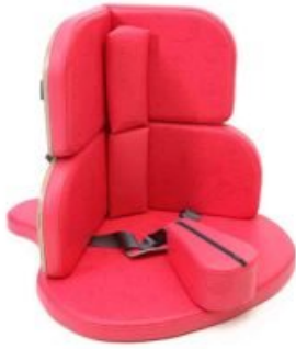
Cuñas respaldo Corner Seat