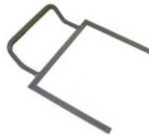
Arc d'estabilització Starfight-Nxt