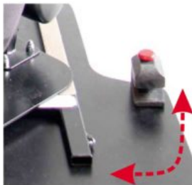
Base giratòria Starfight-Nxt