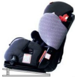
Base ajustable en inclinació Starfight-Nxt