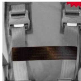
Cinturó conexió cinxes pit Hernik