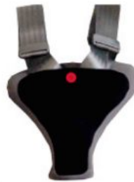
Protector de seguretat Hernik