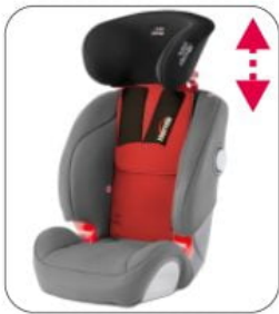
Kit XL Starfight-Nxt