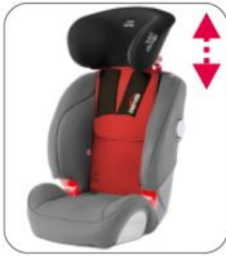
Kit XL Starfight-Nxt