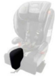
Tac abductor extrible Starfight-Nxt