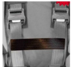
Cinturó conexió cinxes pit Hernik