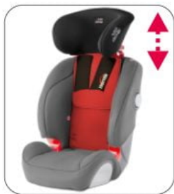
Kit XL Starfight-Nxt