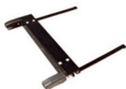
Adaptador Isofix Hernik