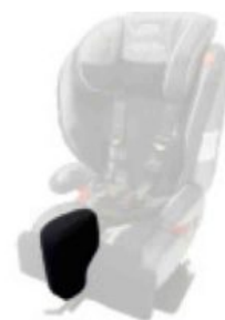
Taco abductor extraíble Starfight-Nxt