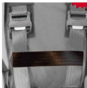
Cinturón conexión cinchas pecho Hernik