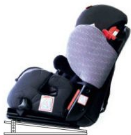
Base ajustable en inclinación Starfight-Nxt