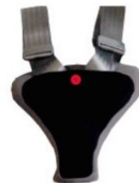
Protector de seguridad Hernik