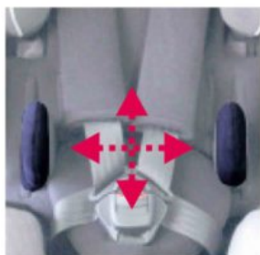
Soportes laterales Starfight-Nxt