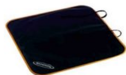
Protector asiento de coche Hernik