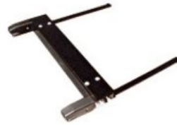
Adaptador Isofix Hernik