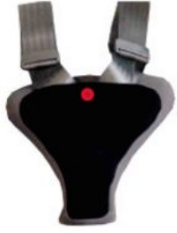
Protector de seguridad Hernik