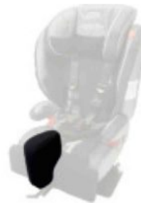
Taco abductor extraíble Ipai-Nxt