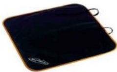
Protector asiento de coche Hernik