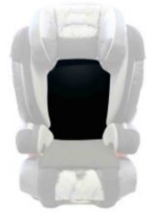
Cojines reductores asiento Ipai-Nxt